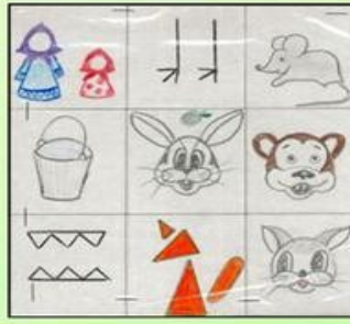
Сказка «У страха глаза велики»