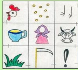
Сказка «Петушок и бобовое зернышко»