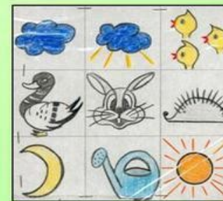
Сказка «У солнышка в гостях»