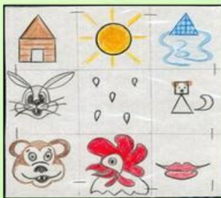
Сказка «Заюшкина избушка»